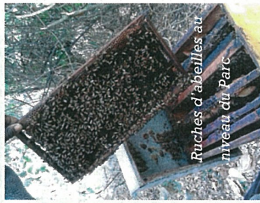
Ruches d'abeilles au niveau du Parc