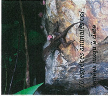
70 espèces animales collectées jusqu'à date