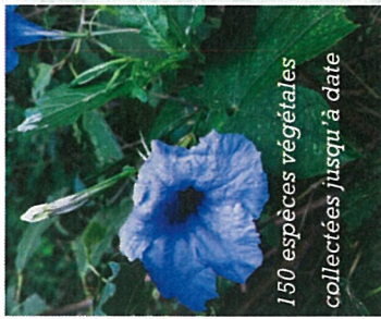
150 espèces végétales collectées jusqu'à date

L'écosystème du Parc renferme une biodiversité impressionnante. Les élèves du Groupe Environnemental du CNDPS ont identifié, inventorié, collecté, et classifié plus de 150 espèces végétales et 70 espèces animales (insectes, oiseaux, reptiles...).