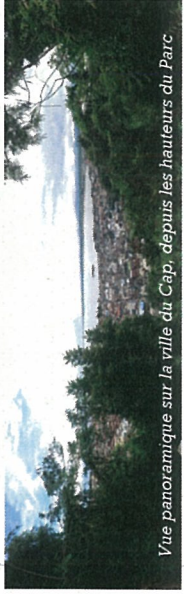
Vue panoramique sur la ville du Cap, depuis les hauteurs du Parc