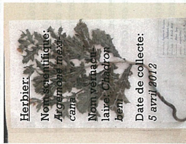
Herbier: Nom scientifique: Argemone mexicana Nom vernaculaire: Chardon Date de collecte: 5 avril 2012