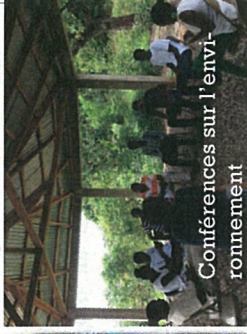
Conférences sur l'environnement