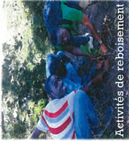
Activités de reboisement